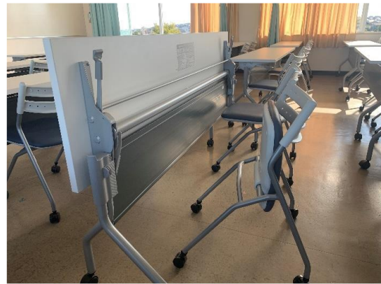
写真2 キャスター付の机・椅子