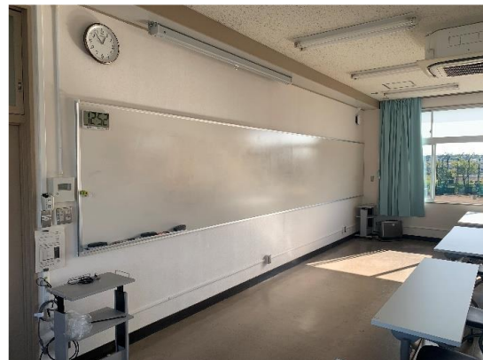
写真4 前面のホワイトボード