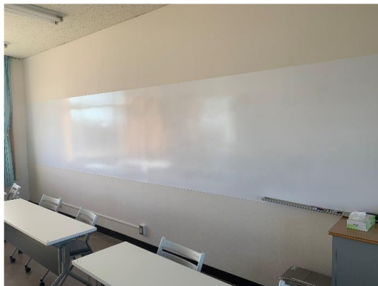
写真5 背面のホワイトボード (シート)