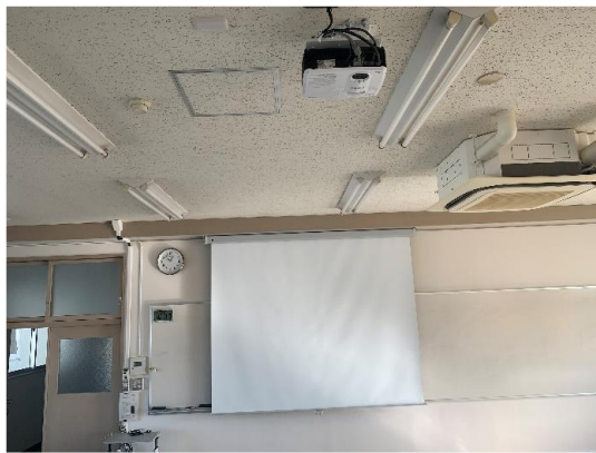
写真3 プロジェクターとスクリーン