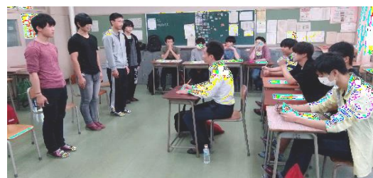
進路ガイダンス（4年生の面接練習）