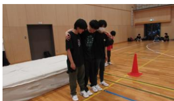
体育大会での三人四脚