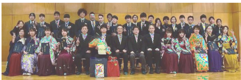
祝 卒業！まるで成人式のような華やかさ