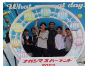
校外学習 ♪ ジブリパークやナガスパへ