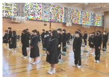
ドキドキの入学式