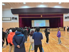
球技大会は年度ごとに内容を決めます