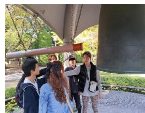
修学旅行では平和学習やUSJへ♪