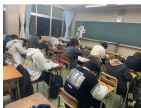
テストはみんな真剣