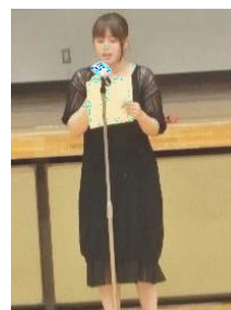
生活体験作文発表会