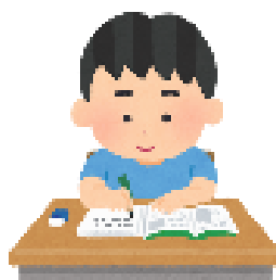
資格の勉強をしたり