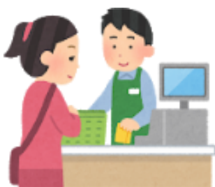
アルバイトをしたり