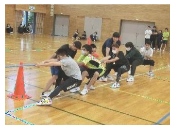
体育大会での綱引き