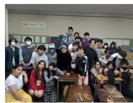
軽音部の発表やクラス出し物がある文化祭