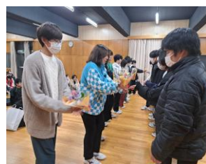
予餞会で先輩への感謝の気持ちを込めて花束を贈呈