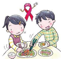
おな さら りょうり た 同じ皿の料理を食べる